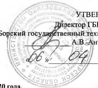
ГРАФИК УЧЕБНОГО ПРОЦЕССА на 2019 – 2020 учебный год