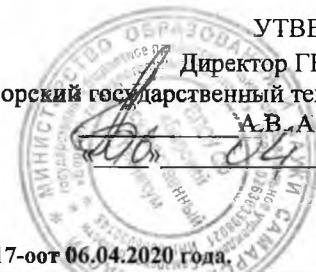
ГРАФИК УЧЕБНОГО ПРОЦЕССА