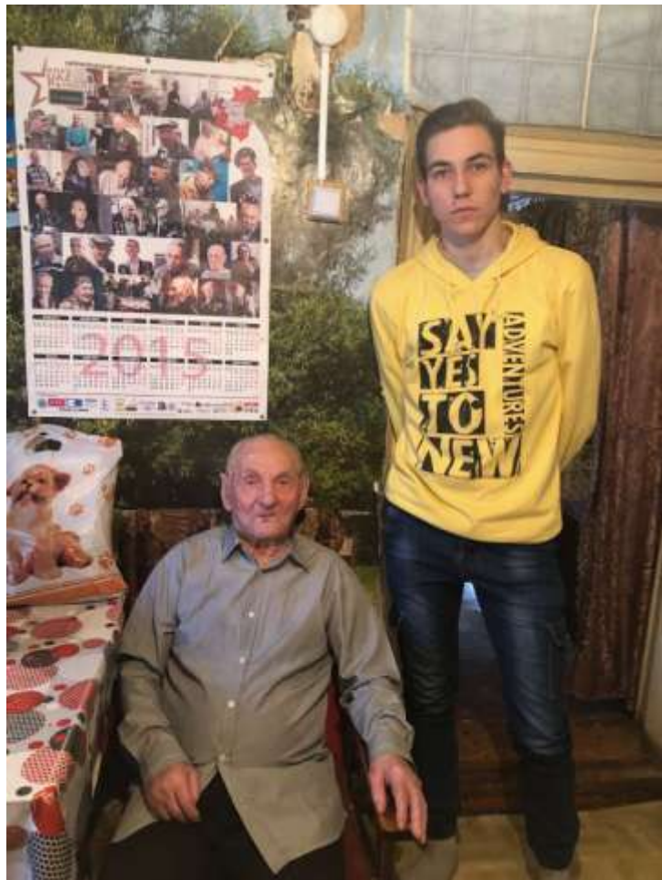
«В гостях у ветерана Великой Отечественной войны» - патриотическая акция