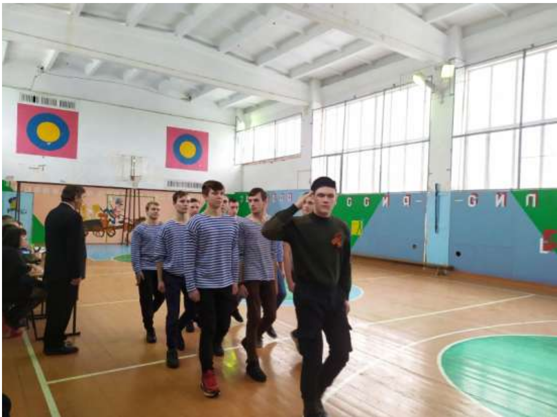
«Есть такая профессия – Родину защищать» - смотр-конкурс строевой подготовки и песни