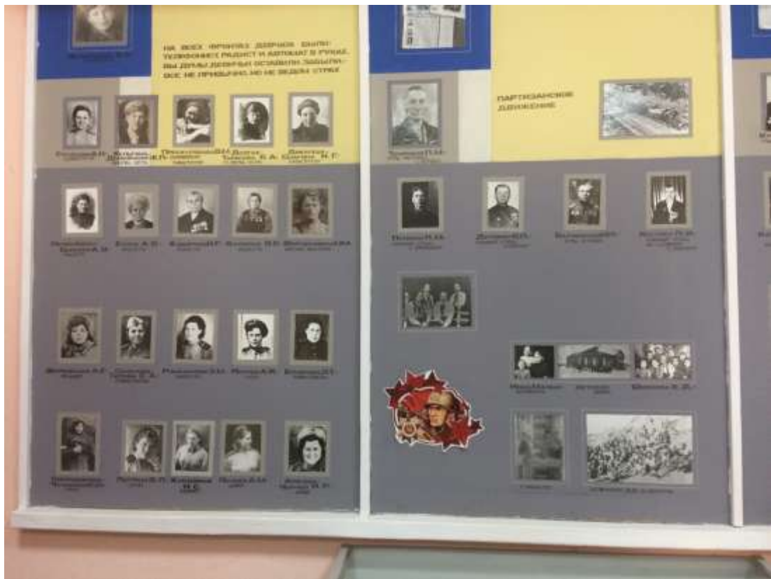
«Женское лицо Победы» - тематическая экскурсия в Борский краеведческий музей