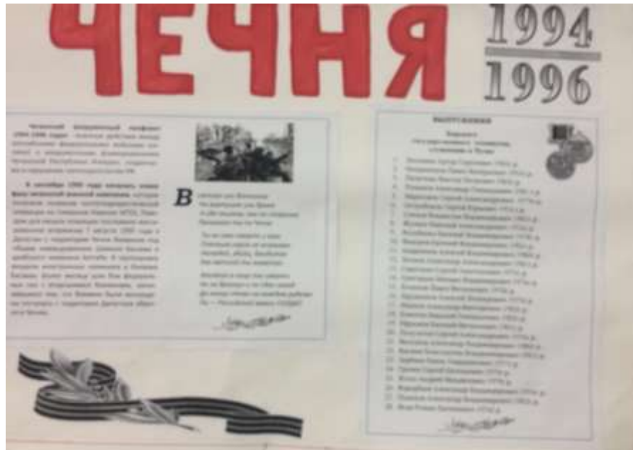
«Три страницы истории» - информационный стенд