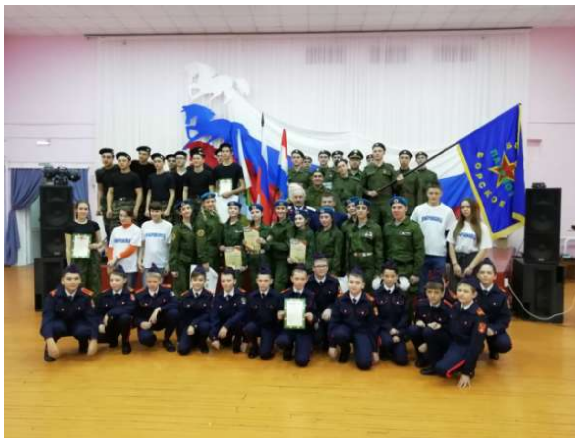
«Бравые солдаты с песнею идут» Районный этап областного смотра-конкурса строевой подготовки и песни