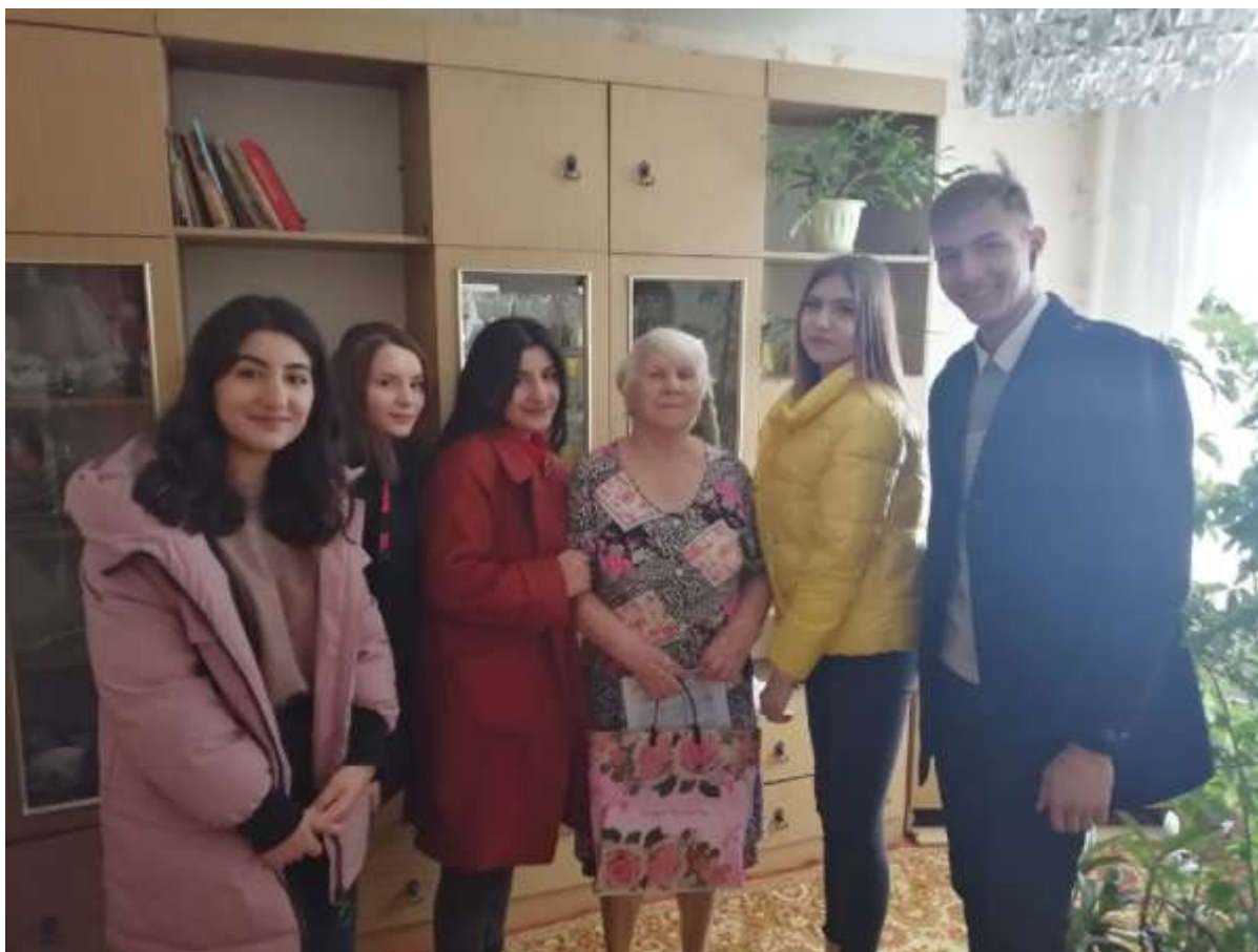
Акция «Письмо ветерану» (в рамках Всероссийской акции «Победа»)