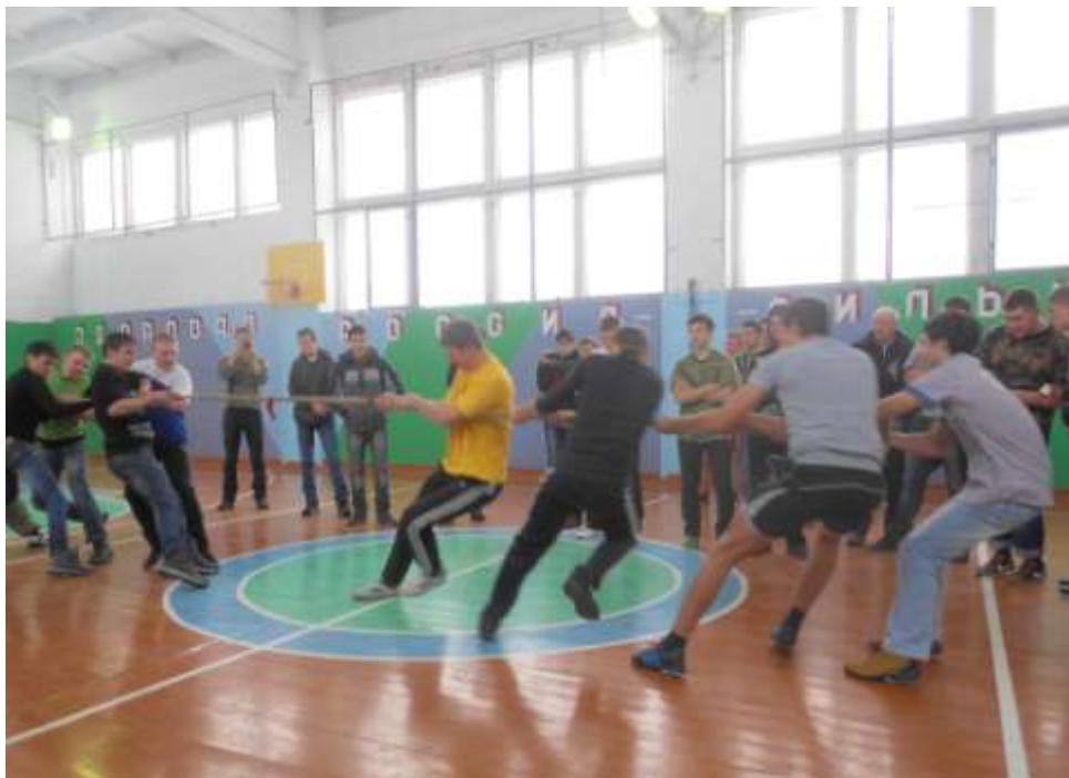
Спортивные соревнования в рамках мероприятия «Есть такая профессия – Родину защищать»