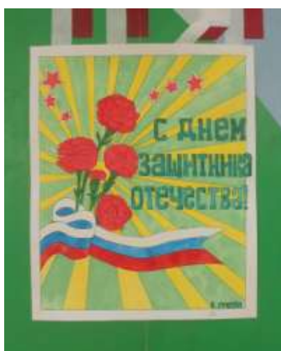
Конкурс стенных газет в рамках мероприятия «Есть такая профессия – Родину защищать»